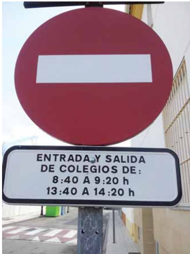
R- 101. ENTRADA PROHIBIDA

Prueba piloto durante una semana y solucionar problemas detectados.