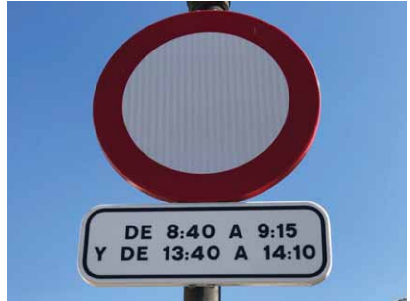
R-100. CIRCULACION PROHIBIDA